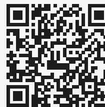
QR platba zálohy

Datum splatnosti je termín připsání platby na účet. Doporučujeme Vám proto zadat platbu s dostatečným předstihem. Nejedná se o daňový doklad pro uplatnění DPH.